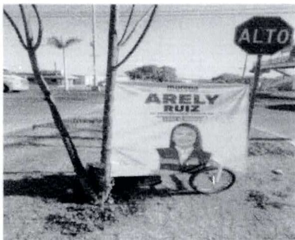
Fotografía número 2.- Se refiere a la misma propaganda electoral del partido político "morena" y de su candidata a la Diputación Local por el 15 Distrito Electoral de Sinaloa.